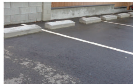
Création de buttoirs sur un parking