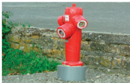
Bornes d'incendie remplacées