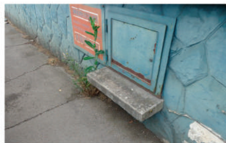
Suppression d'un rebord gênant