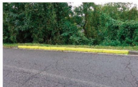
Arrêt et stationnement interdits