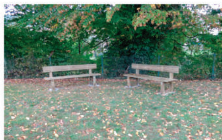
Installation de bancs