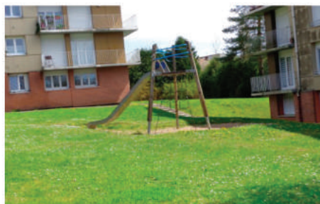
Jeux hors normes supprimés